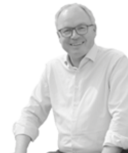
Stephan Pernkopf Präsident

Vorträge zu aktuellen Fragen der Nachhaltigkeit